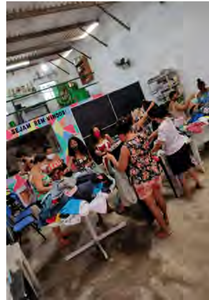
Fotos das ações de voluntariado realizadas pelos Times Norte a Sul, Rio de Janeiro e São Paulo.