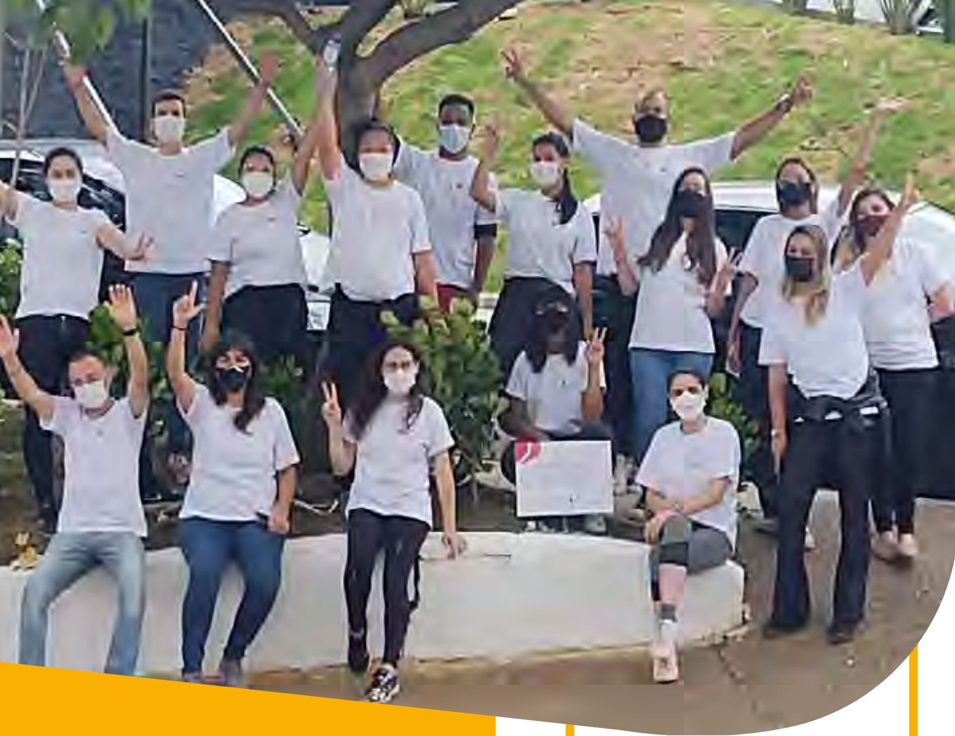
Ação Voluntária na Praça Abelardo Chacrinha Barbosa em parceria com a Living e o Quintal Urbano.