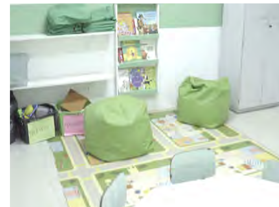
Área de Brincar e salas transformadas na Escola do Saber, (RS).