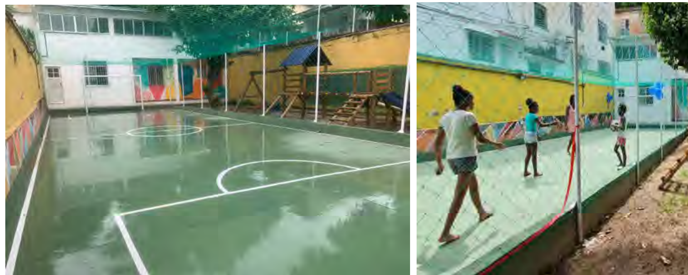
Quadra e espaço de brincar revitalizados no Centro Sociocultural Leticia Fonseca (RJ) (Imagens do acervo da organização).