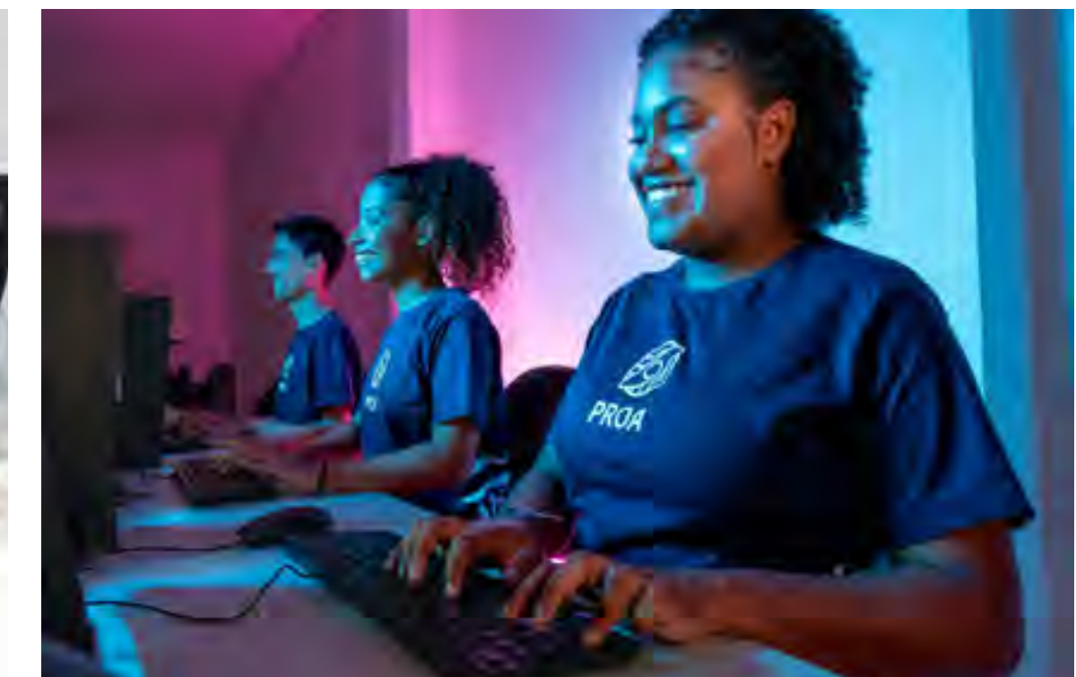
Fotos do projeto Proprofissão, da Associação Instituto PROA (SP).