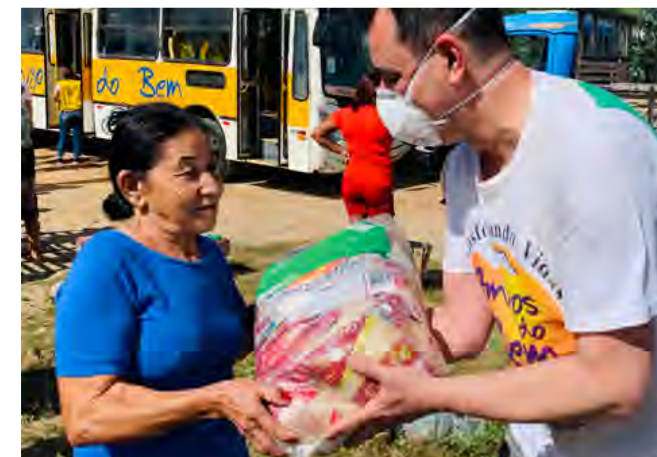
Doações feitas durante a pandemia via organização Amigos do Bem.